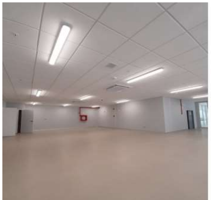
Colegio Profesional de Ingenieros