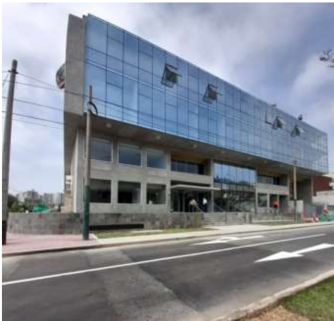
Colegio Profesional de Ingenieros

Durante el año 2021 los productos producidos por Fabrica Peruana Eternit S.A, formaron parte de proyectos importantes y emblemáticos que se desarrollaron a nivel nacional, dentro de los cuales podemos destacar la obra Hospital San Miguel y Hospital Cangallo en Ayacucho, el nuevo Hospital Los Algarrobos, Hospital Coracora, Hospital de Apoyo San Francisco, Colegio Profesional de Ingenieros, entre otros.