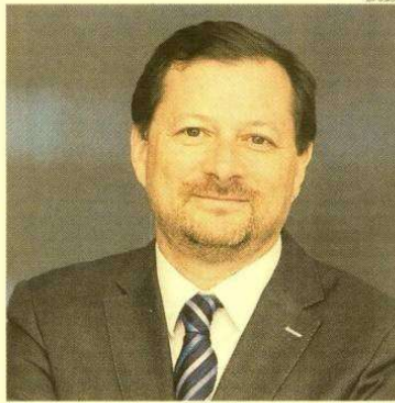
Objetivo. Morales dijo que en el 2021 prevén retomar el crecimiento que tenían previsto antes de la pandemia.

En el caso de Orica disponemos en el Perú de plantas de explosivos a granel, ubicadas en Huachipa y en Congata