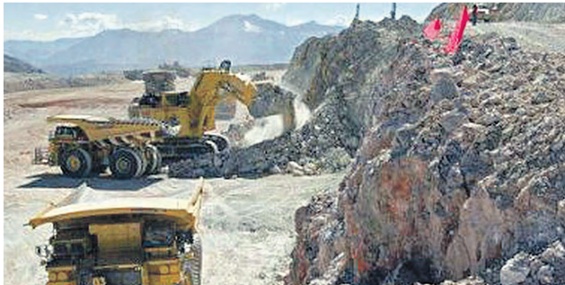
El "modelo Corani" es ejemplar, por lo que la consulta previa fue aprobada por el 100% de las comunidades.