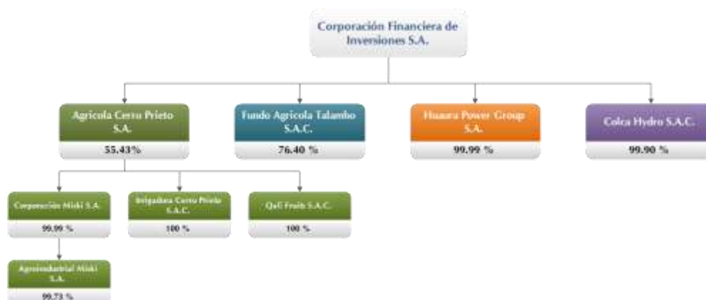
Cuadro N° 2: Grupo Económico