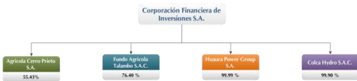
Cuadro N° 5: CFI - Principales Activos

Al 31 de diciembre de 2018, los principales activos de la Compañía se detallan a continuación: