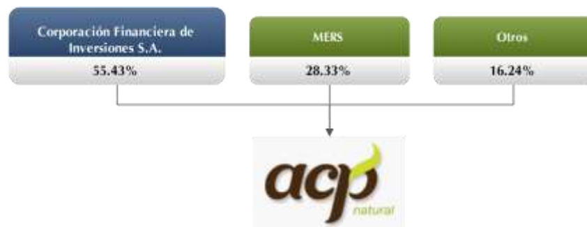
Cuadro N° 6: Participación Directa e Indirecta en Agrícola Cerro Prieto