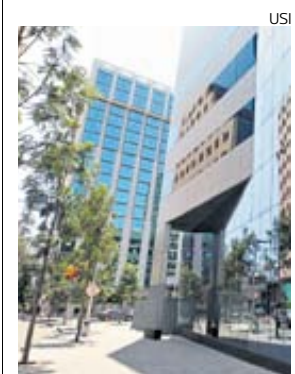
Inmuebles. Podrán ser transferidos luego de cuatro años.

El regulador propuso cambios al reglamento de Fideicomiso de Titulización para Inversión en Renta de Bienes Raíces (Fibra) y Fondo de Inversión en Renta de Bienes Inmuebles (Firbi).