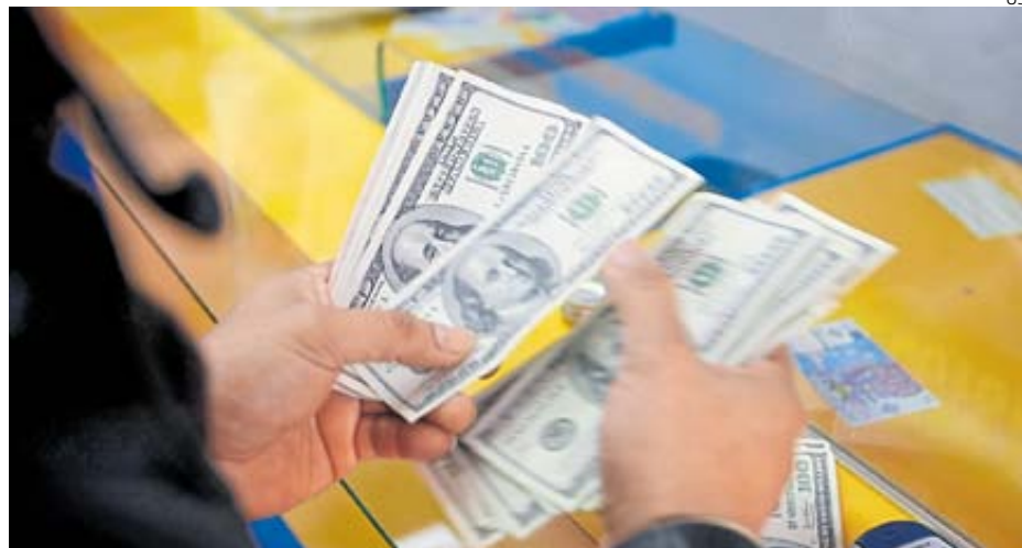
Flujos. Entrada de dólares de extranjeros seguiría presionado a la baja al billete verde.

Los inversionistas de afuera están muy positivos respecto a la situación de la económica local en los próximos meses y está apostando por el Perú, sostuvo. “Están viendo mejores perspectivas para el Perú, comparado con sus pares de la región como Chi-